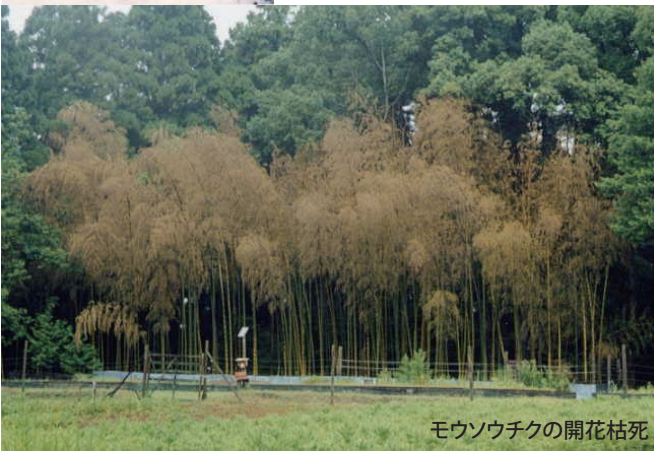
モウソウチクの開花枯死