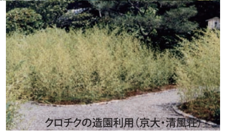
クロチクの造園利用(京大・清風荘)

竹の花が咲くと不吉なことが起こる？ なぜこのようなことが言われるようになったのでしょうか。めったに咲かない竹の花、その花が咲いたとき、竹林では何が起きているのか。 竹の生きざまについて考えてみましょう。