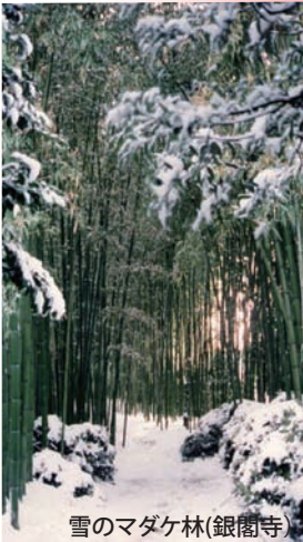
雪のマダケ林(銀閣寺)

竹は滅多に花が咲きませんが、その周期は数年~百数十年と種によって大きく違います。多くは花が咲くと枯れ、花が咲くまでの間、竹はクローン繁殖をします。講演では、竹の植物としての不思議さについて話したいと思います。