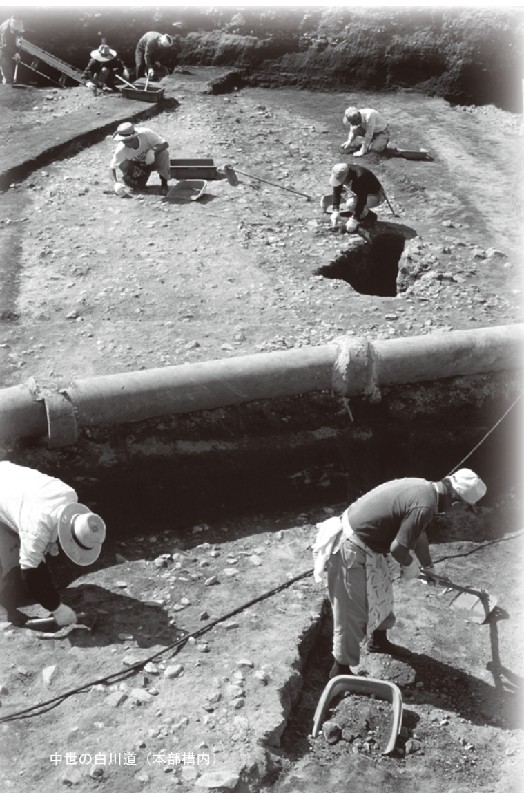
中世の白川道（本部構内）