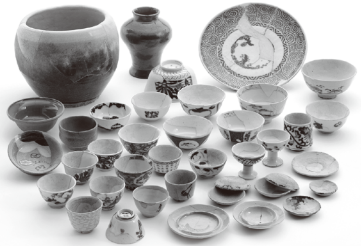
白川道沿いの土取穴から出土した土師器・陶磁器（医学部構内）