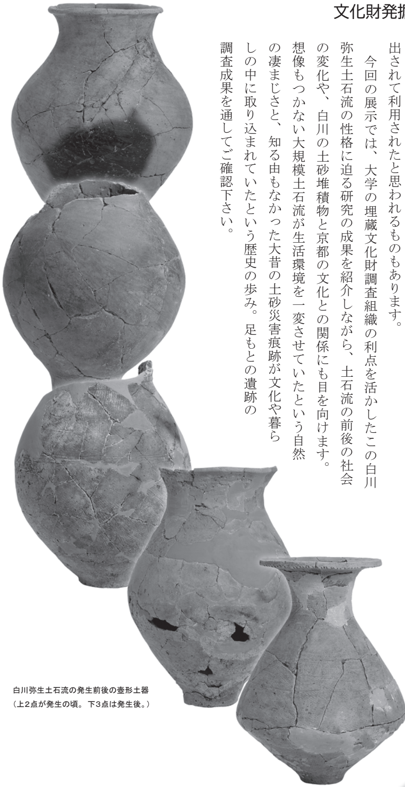
白川弥生土石流の発生前後の壺形土器 (上2点が発生の頃。下3点は発生後。)

今回の展示では、大学の埋蔵文化財調査組織の利点を活かしたこの白川弥生土石流の性格に迫る研究の成果を紹介しながら、土石流の前後の社会の変化や、白川の土砂堆積物と京都の文化との関係にも目を向けます。想像もつかない大規模土石流が生活環境を一変させていたという自然の凄まじさと、知る由もなかった大昔の土砂災害痕跡が文化や暮らしの中に取り込まれていたという歴史の歩み。足もとの遺跡の調査成果を通してご確認下さい。