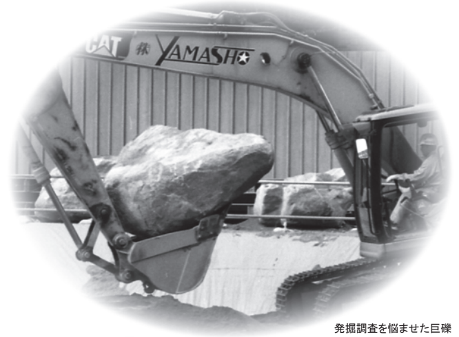
発掘調査を悩ませた巨礫