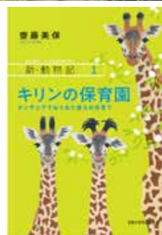
『新・動物記1 キリンの保育園』