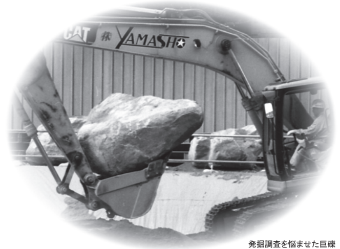
発掘調査を悩ませた巨礫