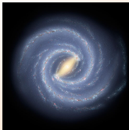
天の川銀河のCG