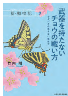
『新・動物記2 武器を持たない チョウの戦い方』